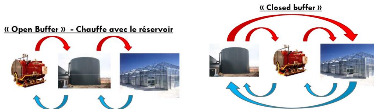
Figure 8.2 : Systèmes « Open-buffer » et « Closed-buffer » 4

Tel que représenté à la figure 8.2, il existe deux configurations principales pour les systèmes d'hydro-accumulation, soit les systèmes de type ouvert (open-buffer) et les systèmes de type fermé (closed-buffer).